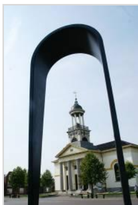
Pelgrimspoort en Groate Kerk Sint-Jacobiparochie