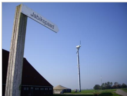
Jabikspaad bij Jorwert

De foto's graag in het originele formaat (dus niet gecomprimeerd) emailen. Gedichten mogen zijn geschreven in de Nederlandse of Friese taal, of in een dialect dat wordt gesproken langs het Jabikspaad. Een mooie kans om uw gedicht of foto te publiceren!